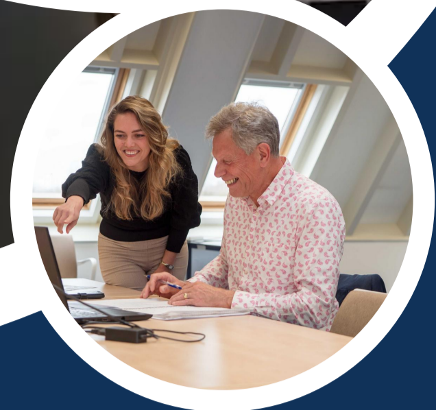
Secretaris en staf