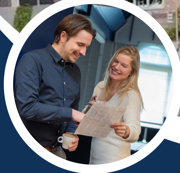
Gemeenteraad Burgemeester & wethouders